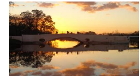
San Antonio de Areco

DEPTO: Pileta/Terraza/Wifi Total $87.000.-