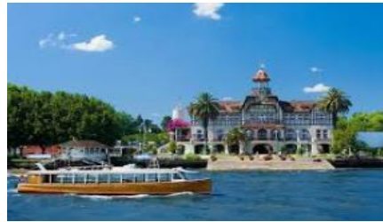
Delta del Tigre

Alojamiento para 2 adultos y 2 menores – 4 días 3 noches