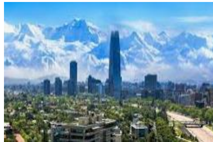
SANTIAGO DE CHILE-CHILE

2 personas – 4 días/3 noches - Del Jueves 6 al Domingo 9 de Abril -