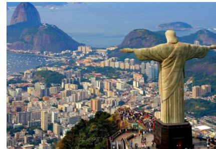
RIO DE JANEIRO-BRASIL